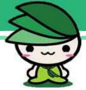
緑区イメージ キャラクター「ミウル」